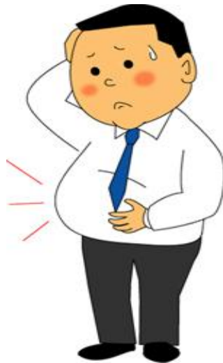
対象者を理解するシート